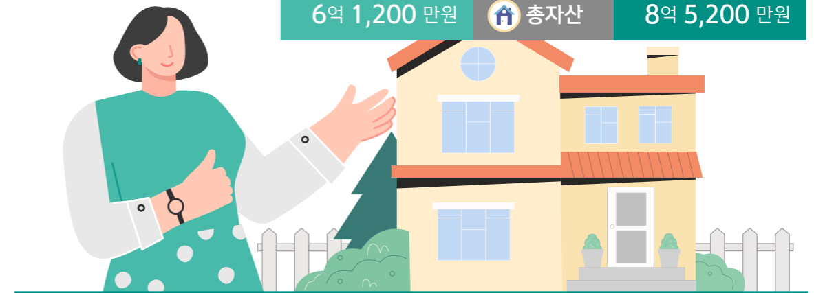
자가 보유 가구

본인 명의의 주택에 거주하는 40대의 월 소득은 570만원으로, 자가 미보유자 대비 130만원 더 벌고 있었는데, 10년 후 50대에 기대하는 소득은 현재보다 11% 상승한 630만원이었다.