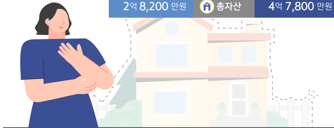
자가 미보유 가구

자가가 아닌 전월세 혹은 타인 명의의 주택에 거주하는 40대의 월 소득은 440만원으로 10년 후 50대가 되면 16% 상승한 510만원을 희망했다.