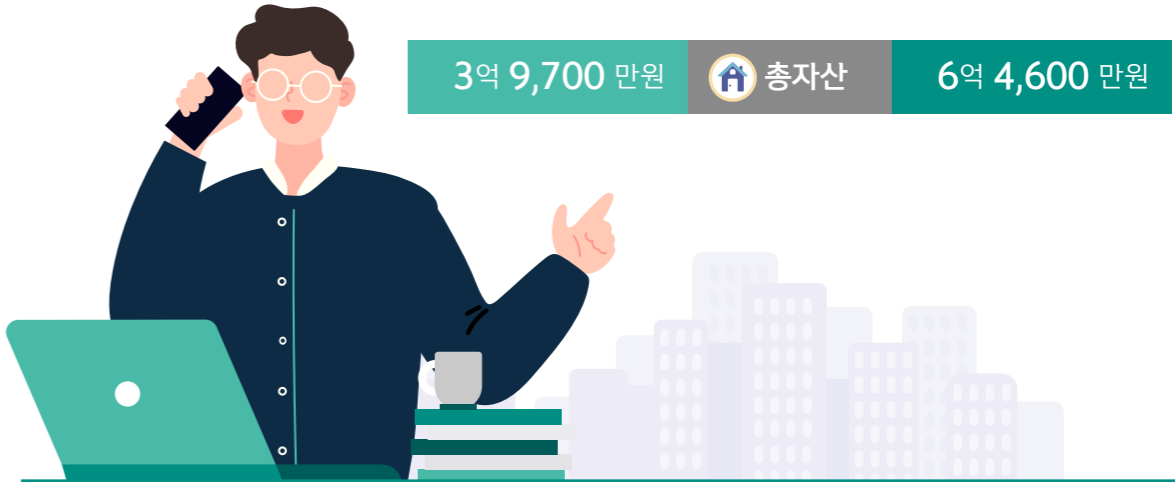
외벌이 30대 기혼

외벌이 가구는 현재 월평균 390만원을 벌어 맞벌이 가구 보다 약 2백만원 적지만, 1인이 버는 소득은 외벌이 가구가 맞벌이 가구(290만원) 보다 더 컸다. 이들의 10년 후 소득은 240만원 높은 630만원을 벌길 바랐다. 현재 보유 자산은 3억 9,700만원으로 4억원에 조금 못미치는 금액이었으나, 10년 후에는 1.6배인 6억 4천만원대의 자산을 보유할 것으로 생각해 10년 후 맞벌이 가구와의 격차가 줄 것을 희망했다.