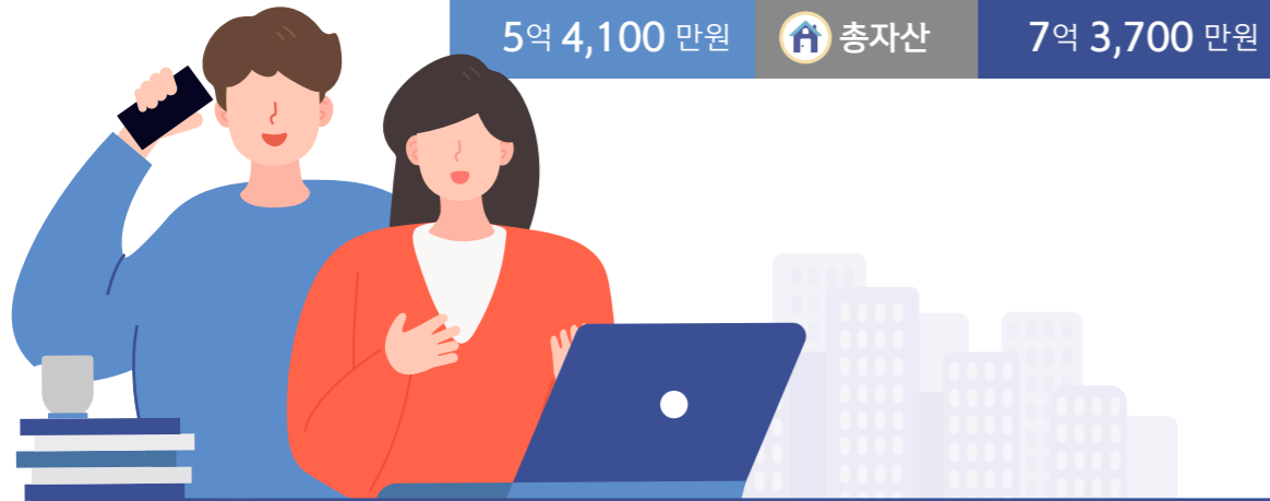
맞벌이 30대 기혼

부부 모두 근로활동을 하는 맞벌이 가구의 월 소득은 580만원으로, 10년 후에는 현재보다 1.4배(210만원) 많은 790만원을 벌기를 희망했다. 현재 보유 자산인 5억 4,100만원에서 10년 후 7억 3,700만원으로 소득 증가폭만큼 자산도 늘길 기대했다.